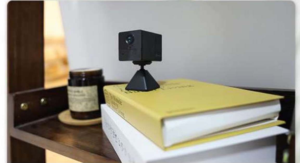
En la sala de lectura