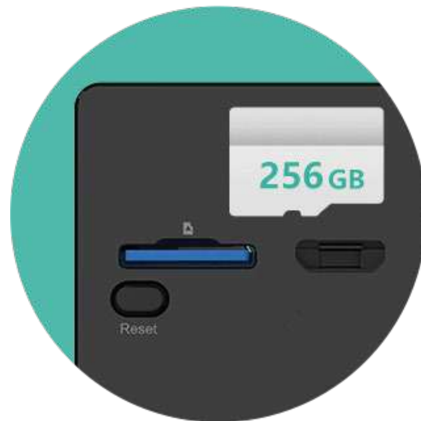
Compatible con tarjetas microSD 2

Conserve los vídeos que haya grabado en una tarjeta microSD local de hasta 256 GB o suscríbase a CloudPlay de EZVIZ para disfrutar de un almacenamiento en la nube totalmente cifrado para una mayor tranquilidad.