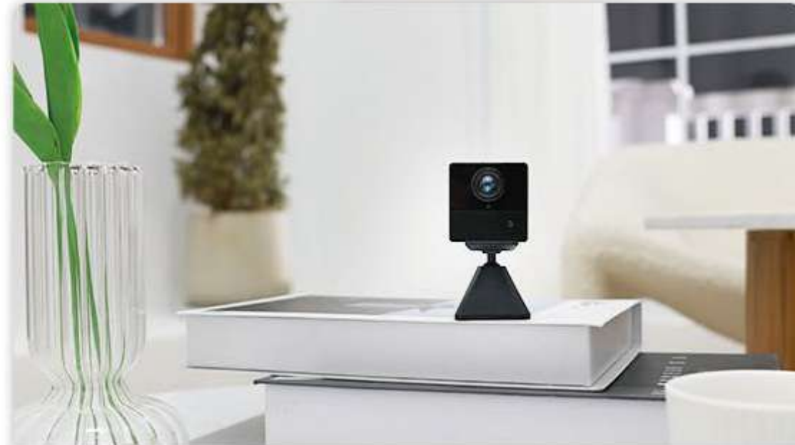
En el salón