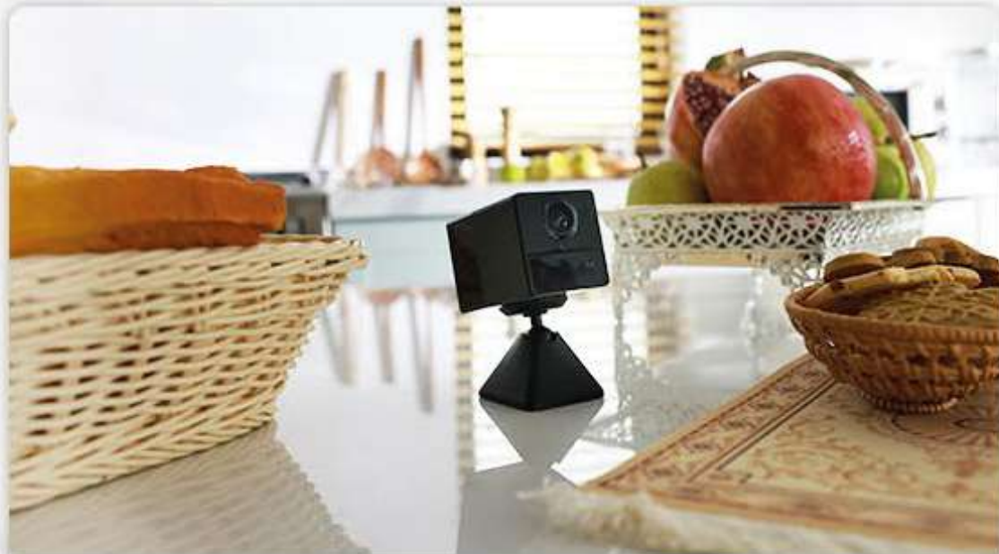
En la cocina

Las cámaras domésticas inteligentes no tienen que ser voluminosas ni intrusivas. La BC2 de EZVIZ está perfectamente diseñada para lucir un aspecto moderno, refinado y compacto. La BC2 armoniza con cualquier estilo de hogar.